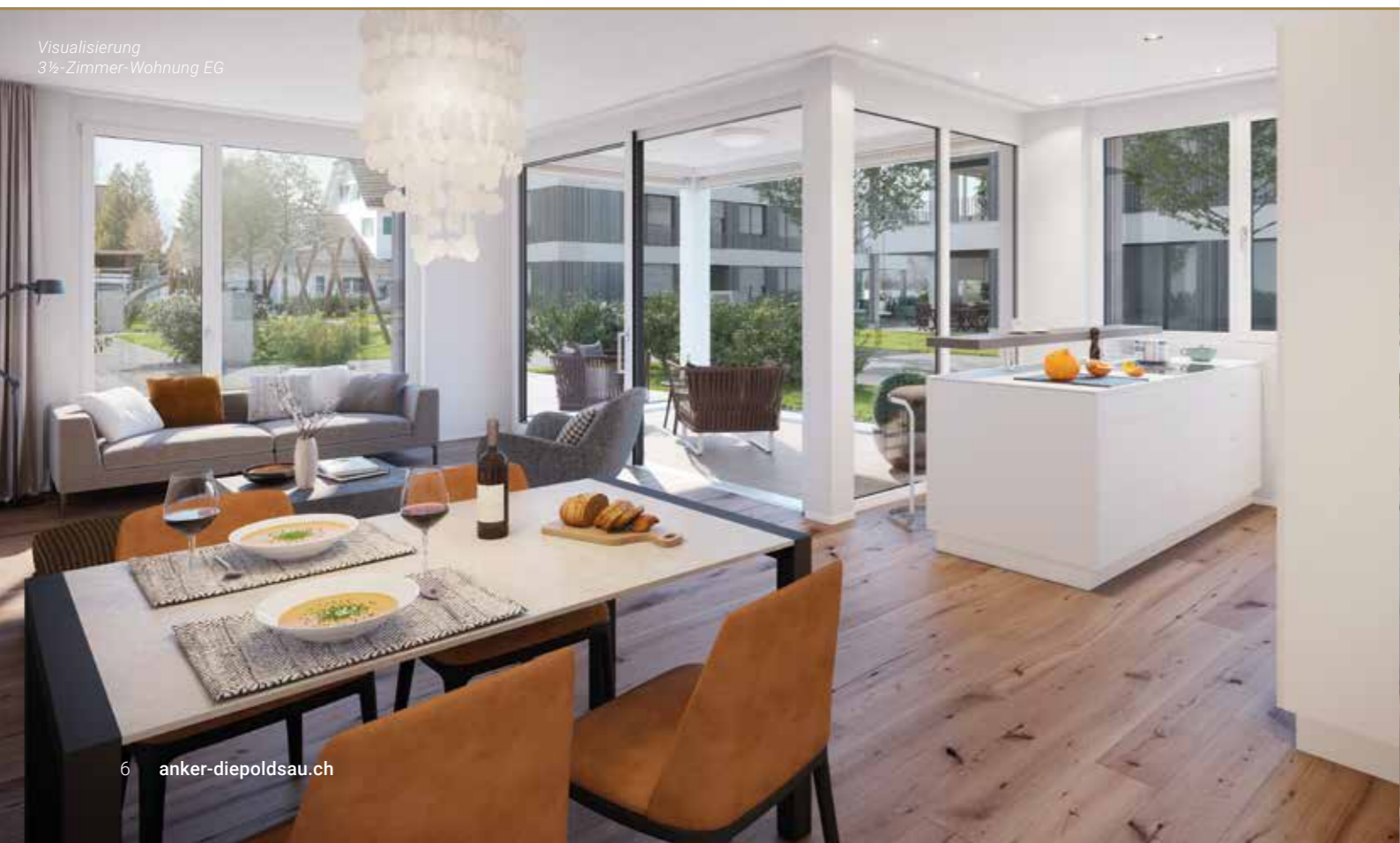
Visualisierung 3½-Zimmer-Wohnung EG