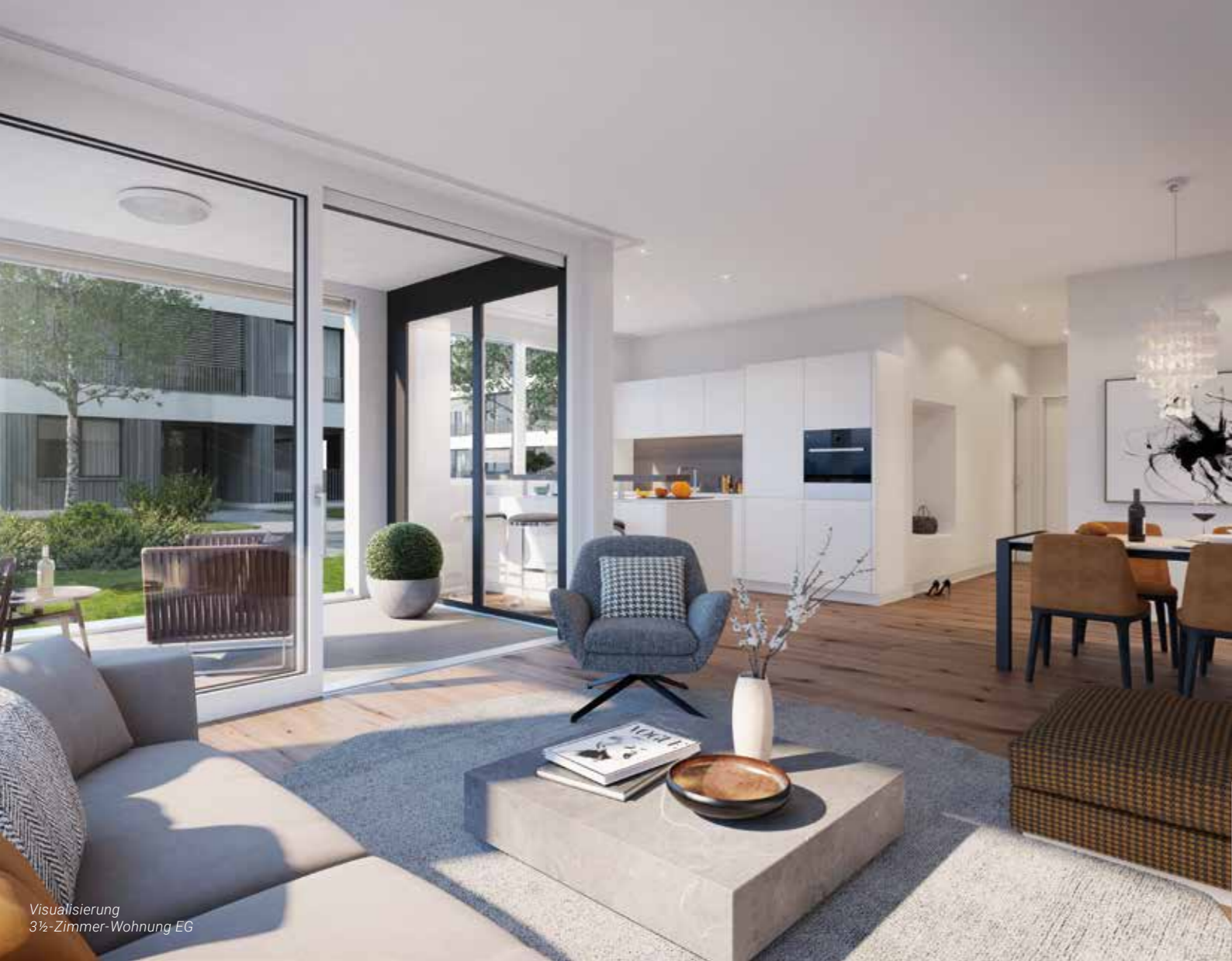
Visualisierung 3½-Zimmer-Wohnung EG