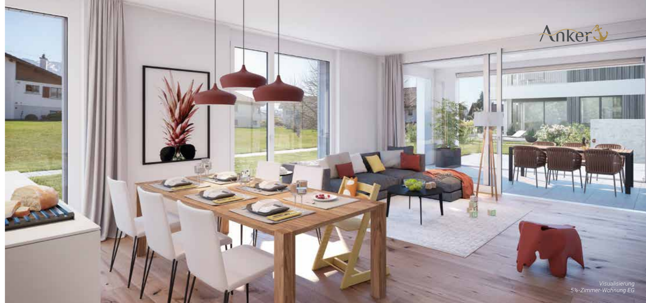
Visualisierung 5½-Zimmer-Wohnung EG

Paare, Familien und Personen in den besten Jahren: Anker lebt von einer angenehmen Durchmischung von Bewohnern mit unterschiedlichen Lebensplänen. Allen gemeinsam ist der Wunsch nach der Wohlfühlwohnung.