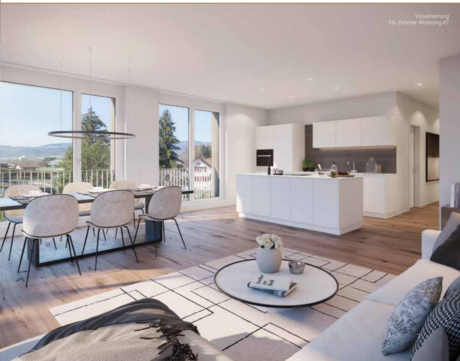
Visualisierung 3½-Zimmer-Wohnung AT