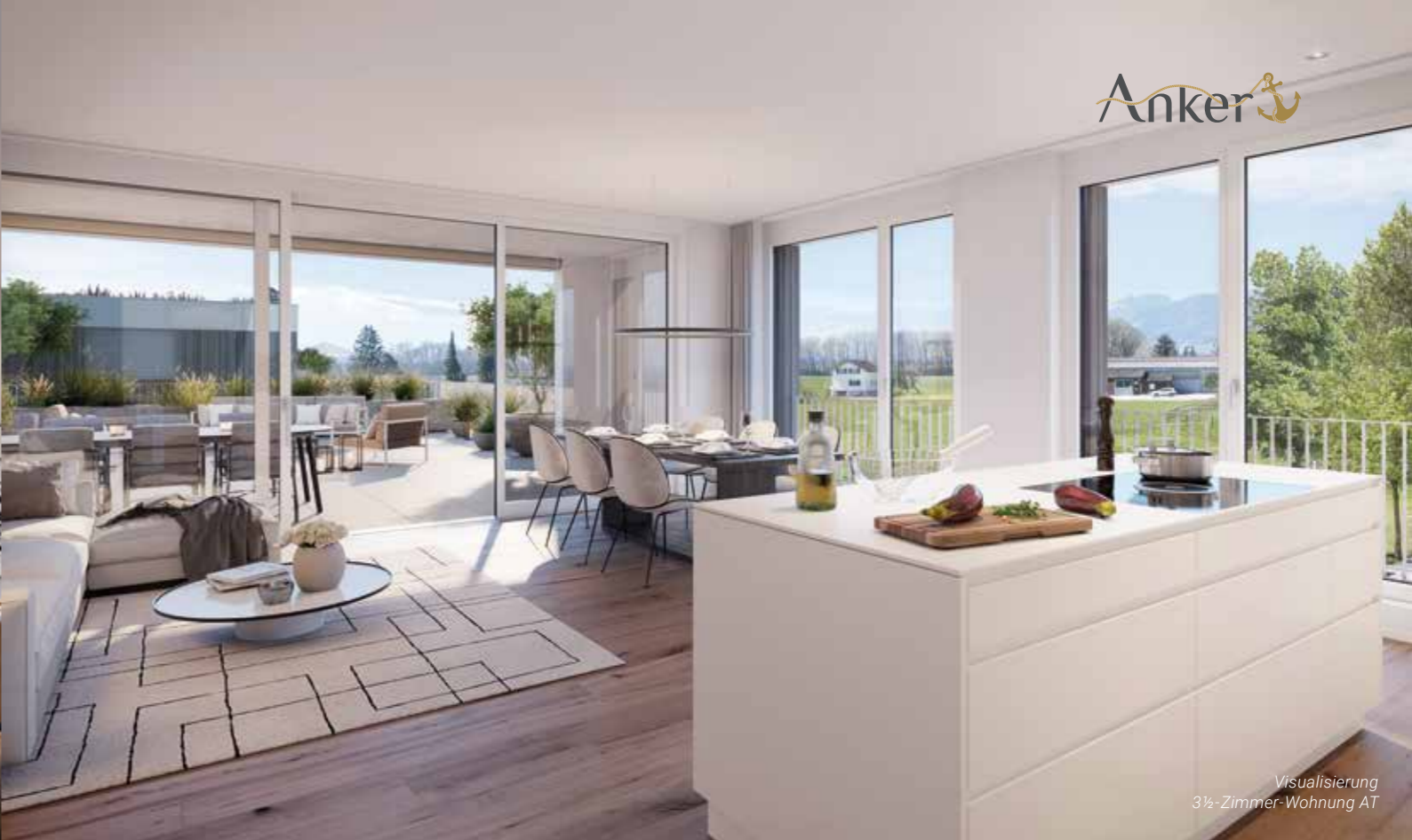
Visualisierung 3½-Zimmer-Wohnung AT