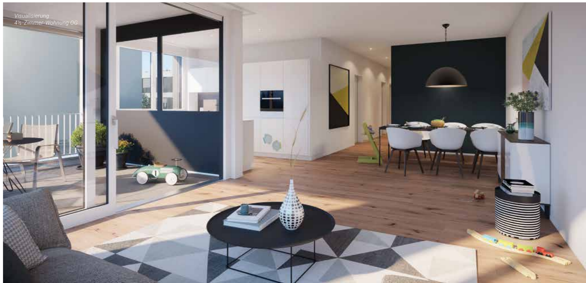
Visualisierung 4½-Zimmer-Wohnung OG